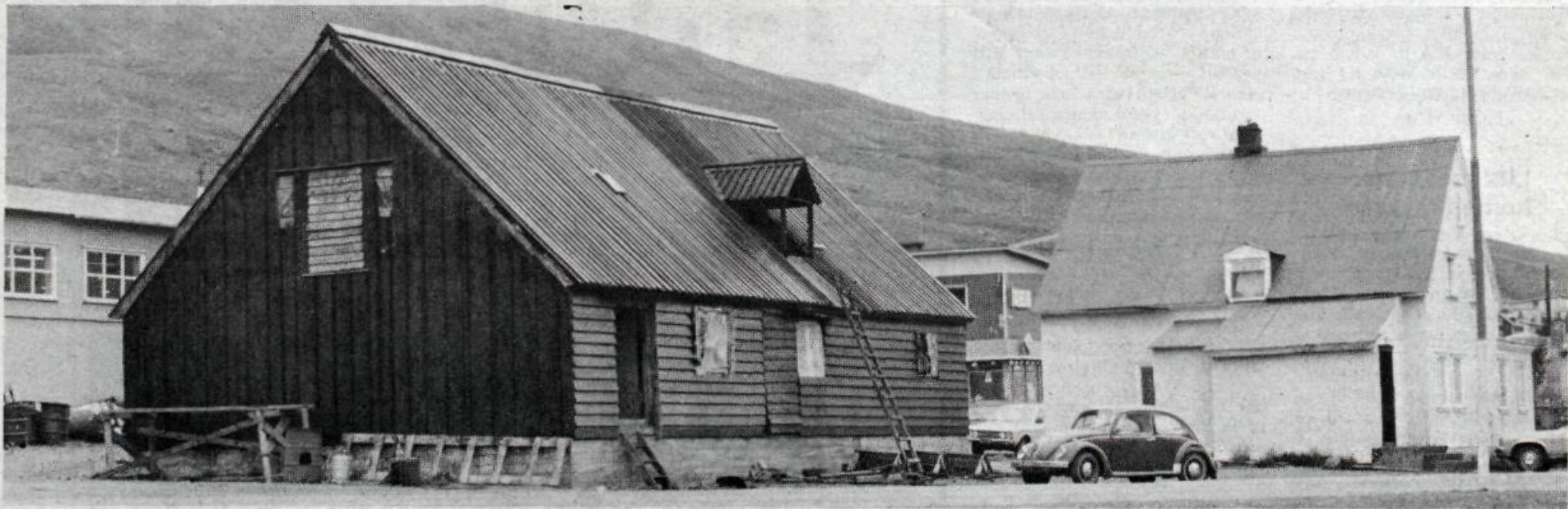
Gamla Búð á Eskifirði. Til hægri eru skrifstofur Hraðfrystihúss Eskifjarðar í svonefndu Útkaupstaðarhúsi, en þar var lengi íbúðarhús faktorsins á Eskifirði.

GAMLA-BÚÐ á Eskifirði var á sínum tíma merkileg miðstöð verzlunar og menningar á Austfjörðum. Bændur og sjómenn komu um langan veg til að verzla í Gömlu-Búð, streitan háði ekki, þó þreytan væri stundum mikil. Menn gáfu sér tíma til að setjast niður og ræða málin — gjarnan yfir höfgum drykk. Margt hefur verið brallað í Gömlu-Búð mestan hluta nítjándu aldarinnar. Þar var höndlað með allt milli himins og jarðar og ýmis önnur iðja stunduð þar. Þar var á sínum tíma fleygað niður silfurberg úr Helgustaðarnámu utan við Eskifjörð. Heimsins bezta silfurberg, sem m.a. var notað í sjónauka og er enn í notkun í vitalampa á einu af syðstu annesjum Portúgals.